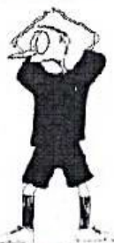
HRA V MALÉM BRANKOVIŠTI