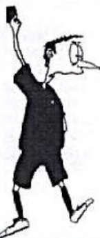
VYLouČENÍ DO KONCE UTkáNÍ