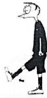
HRA VYSOKOU NOHOU