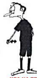
HRA NA ZEMI dlaní dolu