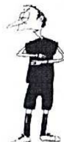
ŠPATNÉ STŘÍDÁNÍ rotace paží